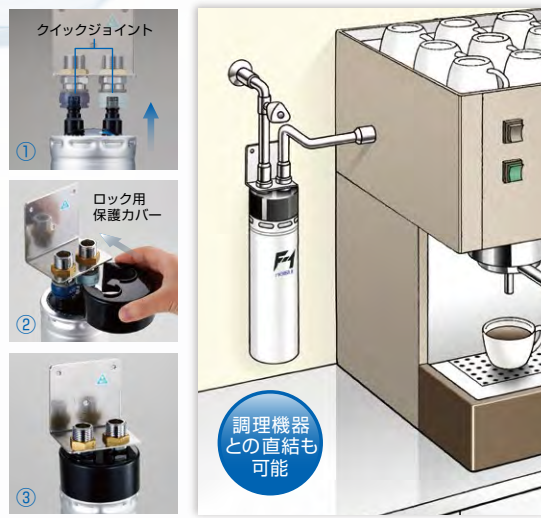
クイックジョイントにワンタッチで接続でき、ロック用保護カバーで浄水器カートリッジが外れないようロックすることができます。